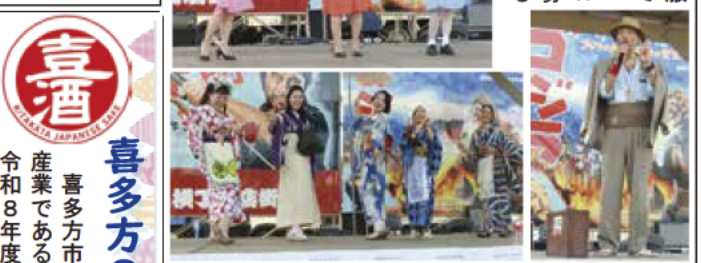
開催日時：6月27日(土) 午後3時30分 コンテストスタート 午後5時00分 会場内パレード 開催会場：メインステージ

「これぞ昭和」と思える服装に身を包み、大観衆の前でアピール！ レトロファッションShowには今年も多数の応募があり、昭和を彷彿とさせる自慢の衣装を披露する。コンテストの後は参加者が自慢のコーディネートと共ニ会場内をパレードする。 果たして、今年の栄冠はどのファッションに輝くのか？