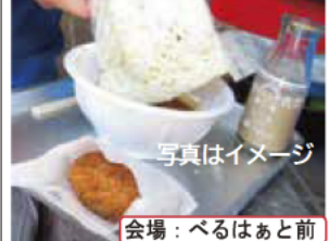
写真はイメージ 会場：べるはあと前